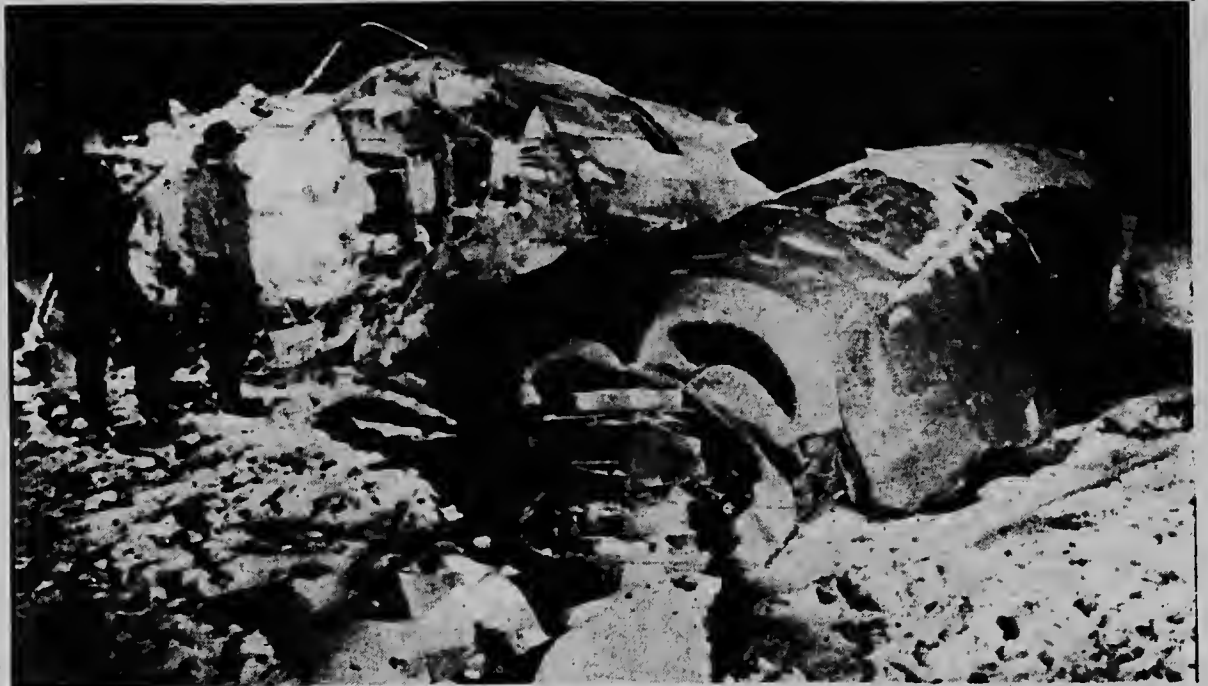
Dos homber aki ta tirando bista riba loque a sobra di un avion bi-motor Convair 580 di Lake Central Airlines qu a cai antayera riba un plantacion di maishi na Kenton, Ohio. Tur e 38 pasaheronan qu tabata bordo di e avion a muri ora e avion a cai.